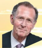
Prof. Dr. Dr. h.c. Bert Rürup

ehem. Vors. d. Sachverständigenrates d. Bundesregierung; Präsident Handelsblatt Research Institute