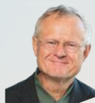
Prof. Dr. Armin Grau

MdB, Sprecher f. Arbeit u. Soziales, Bündnis 90/Die Grünen