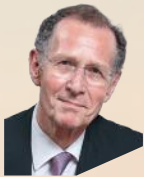
Prof. Dr. Dr. h.c. Bert Rürup

ehem. Vors. d. Sachverständigenrates d. Bundesregierung; Präsident Handelsblatt Research Institute